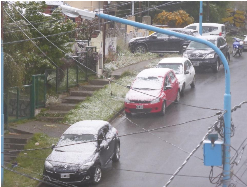
1月12日には雪が降った。