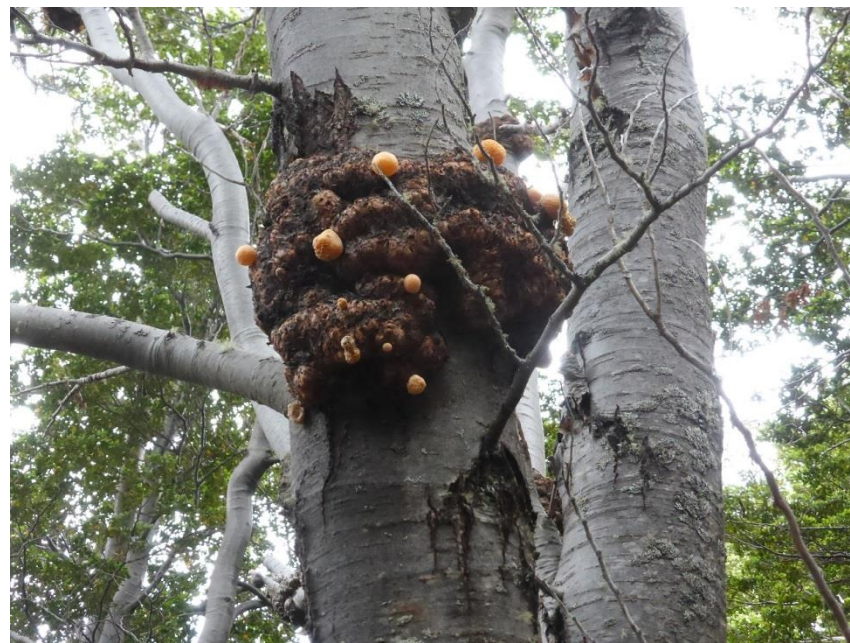
キッタリアという奇生植物