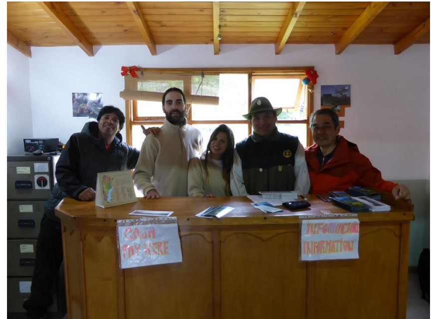
国立公園の入場ゲートで、 公園管理レンジャ-の皆さんと。 入場料1人85ペソ(約1700円)