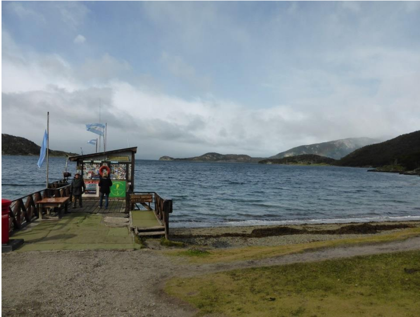
ロカ湖畔のお土産や