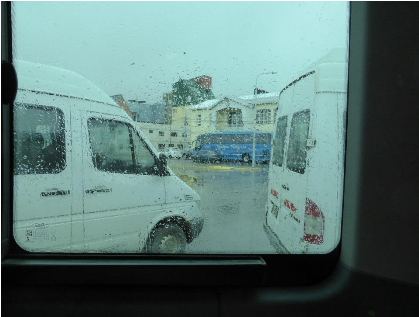
8.30 Ushuaiaのマイプー通りのバス乗り場 早朝からみぞれ