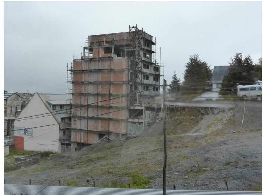
建築中のビル。安全対策はいい加減？